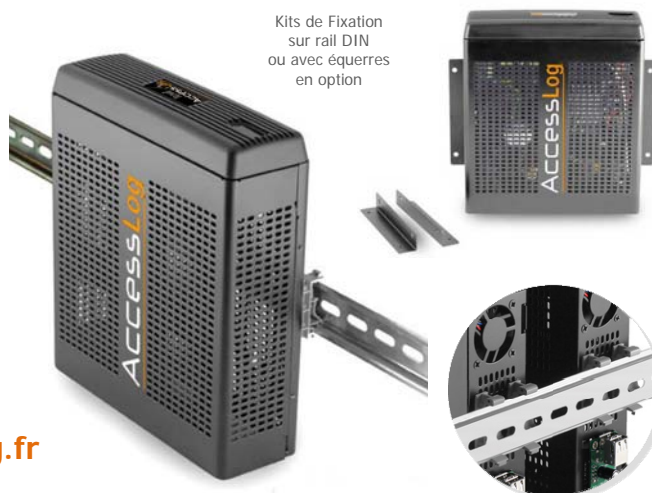
Kits de Fixation sur rail DIN ou avec équerres en option